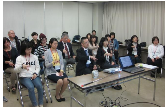
左写真【手話奉仕員養成講座の様子】