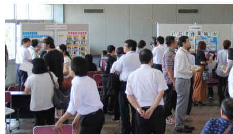
昨年の事業所紹介フェアの様子