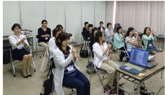
左写真 【「手話奉仕員養成講座の様子。『釣り』を手話で表しています】