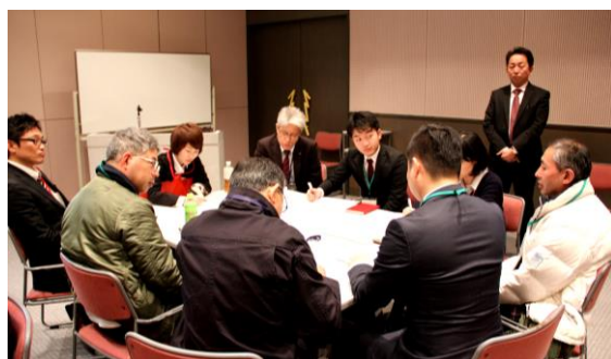
【グループでの意見交換の様子】

参加者からは「採用“0”からの取り組みについて参考になった」「当事者のリアルな思い、企業の視点について教えていただき貴重な時間でした」等の感想をいただきました。今年度もセミナーを開催予定です。たくさんの方の参加をお待ちしております。