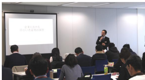
【梅村氏による講演の様子】

参加者からは「障害者雇用の状況、課題について理解を深めることができました」「一般就労の必要条件、長く働けることがいかに重要かということが分かりました」など、それぞれの立場から働くために大切な力について理解を深められていました。