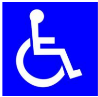
障害者のための 国際シンボルマーク

障がい者が利用できる建物、施設であることを明確に表すための世界共通のシンボルマークです。