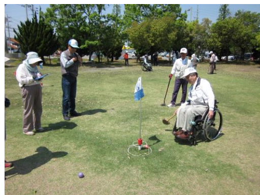
↑春に開催されたグランドゴルフ大会。 ファインプレーに大盛り上がり！